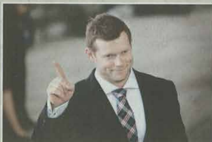
HVEM: Joachim B. Olsen. HVAD: MF, Liberal Alliance HVOR: Sct. Mariæ Skole i Aalborg (katolsk privatskole).